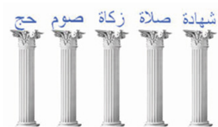
Die fünf Säulen des Islams